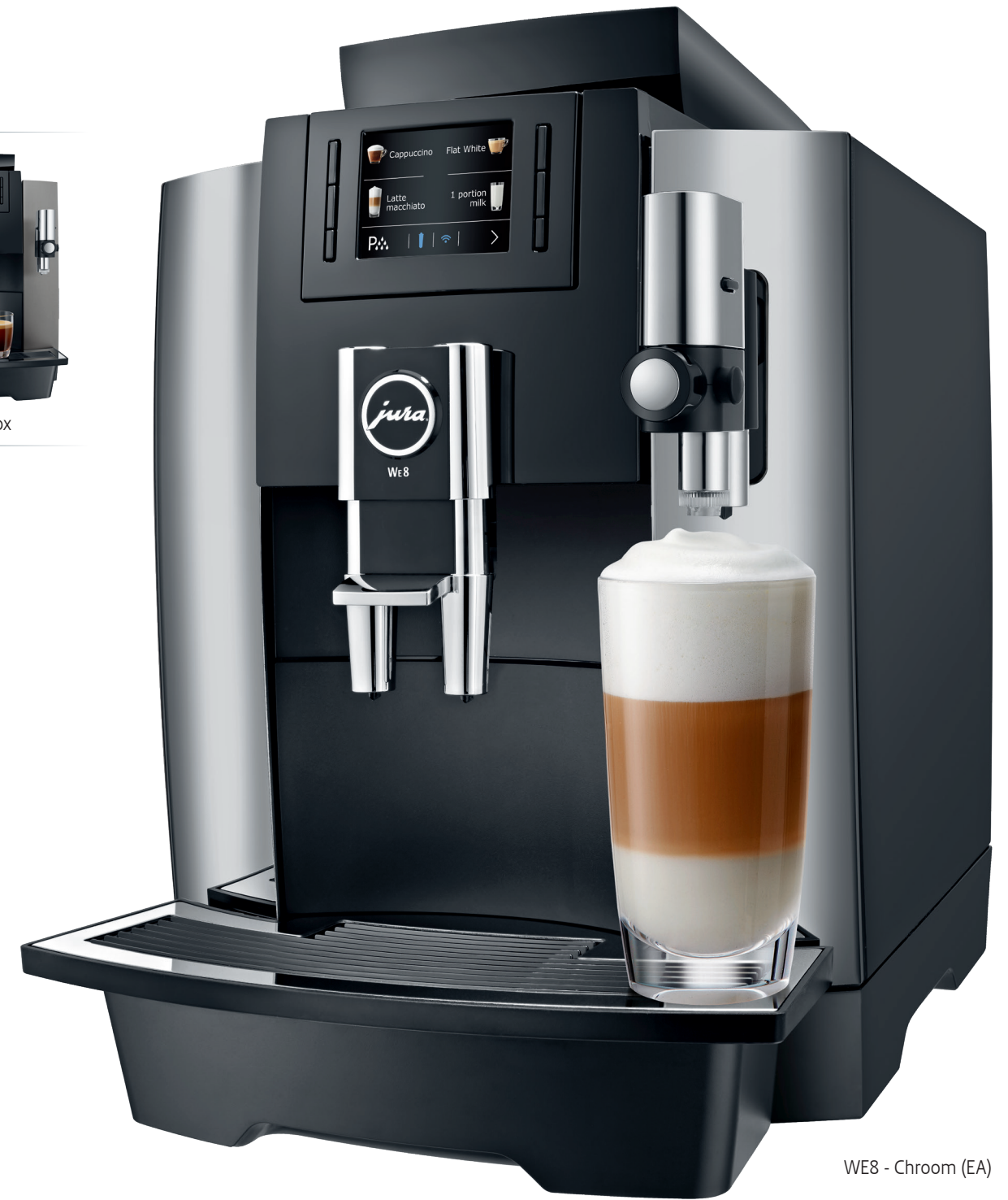
WE8 - Chrom (EA)