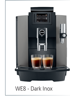
WE8 - Dark Inox